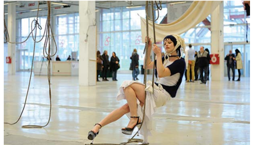
Performance Dry Me a River , Bauhaus, duben 2017.